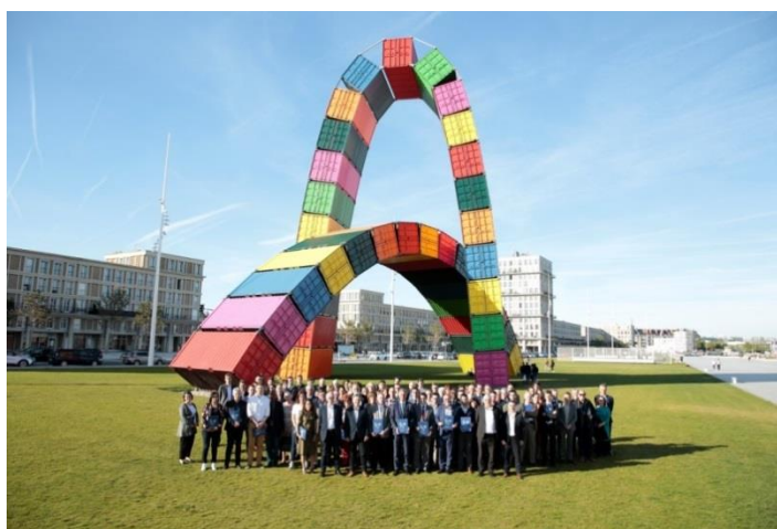
Les porteurs de projets réunis pour le lancement de la campagne de soutien à Le Havre Smart Port City (22 mai 2019)

Engagée depuis plus d'un an, le projet a su fédérer et attirer une communauté d'acteurs plurielle capable de répondre aux défis qui se présentent, de manière réactive, créative et innovante : entreprises et institutions, acteurs privés et publics, chercheurs et industriels, offreurs de services et clients en quête de solutions. Ce collectif ne cesse de se renforcer à mesure qu'émergent et se structurent des projets d'intérêts partagés.